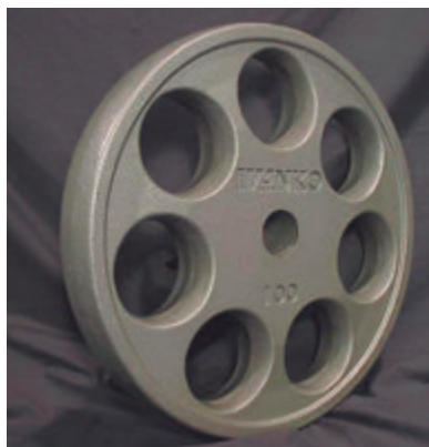
Pullem Plate – 1978 (a sinistra), Ivanko Iron Round Hole Plate – 1999 (a destra) – Per il nostro EZ Lift abbiamo optato per l'approccio con presa multipla per la maggiore comodità e sicurezza.