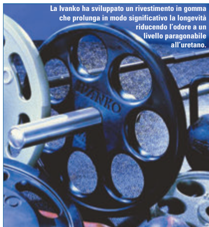
La Ivanko ha sviluppato un rivestimento in gomma che prolunga in modo significativo la longevità riducendo l'odore a un livello paragonabile all'uretano.

Crediamo quindi che l'uretano abbia un grosso potenziale inesperto, però preferiamo i nostri prodotti rivestiti in gomma alle coperture in uretano introdotte finora nel mercato, con una discriminante. La gomma deve essere della formula brevettata