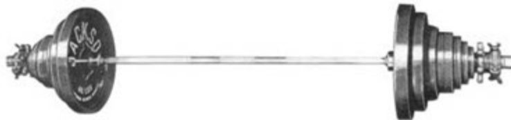
Una visione angolata del bilanciere migliore al mondo: il Jackson International Olympic Official Revolving Sleeve Contest Barbell. Il n° 1-A.