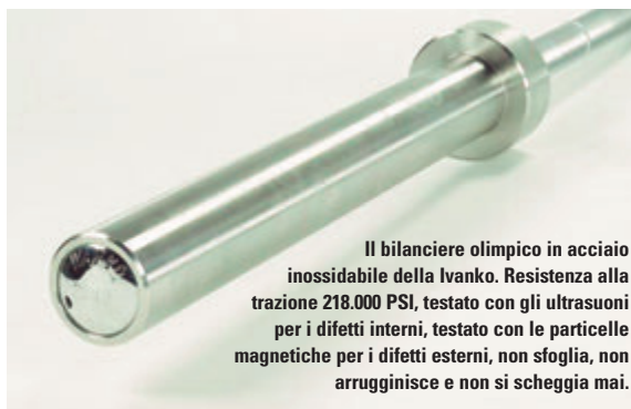
Il bilanciante olimpico in acciaio inossidabile della Ivanko. Resistenza alla trazione 218.000 PSI, testato con gli ultrasuoni per i difetti interni, testato con le particelle magnetiche per i difetti esterni, non sfoglia, non arrugginisce e non si scheggia mai.

Nel mercato di oggi ci sono molti bilancianti olimpici che sbandierano frasi a effetto: "150.000 PSI", "testato a 900 kg", "cromatura pesante"; ma, come succede spesso, per offrire un servizio migliore al mercato è necessario innovare oltre quello che suona bene.